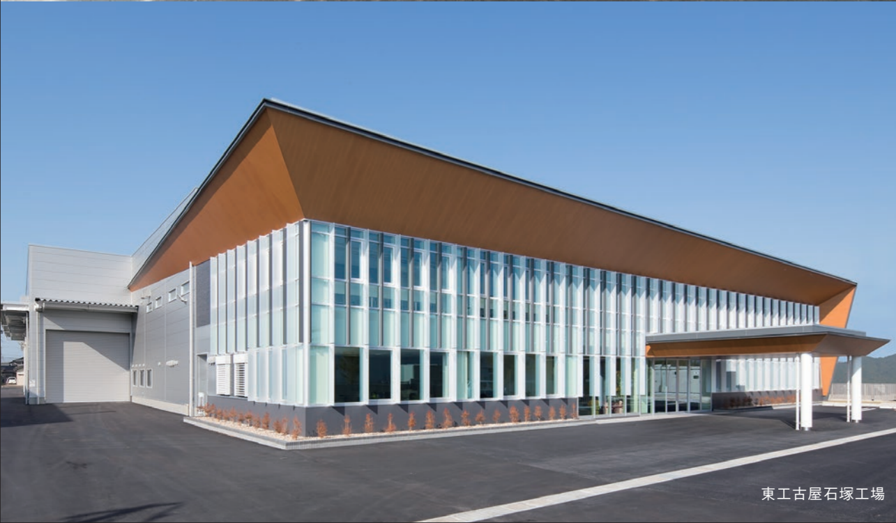
東工古屋石塚工場