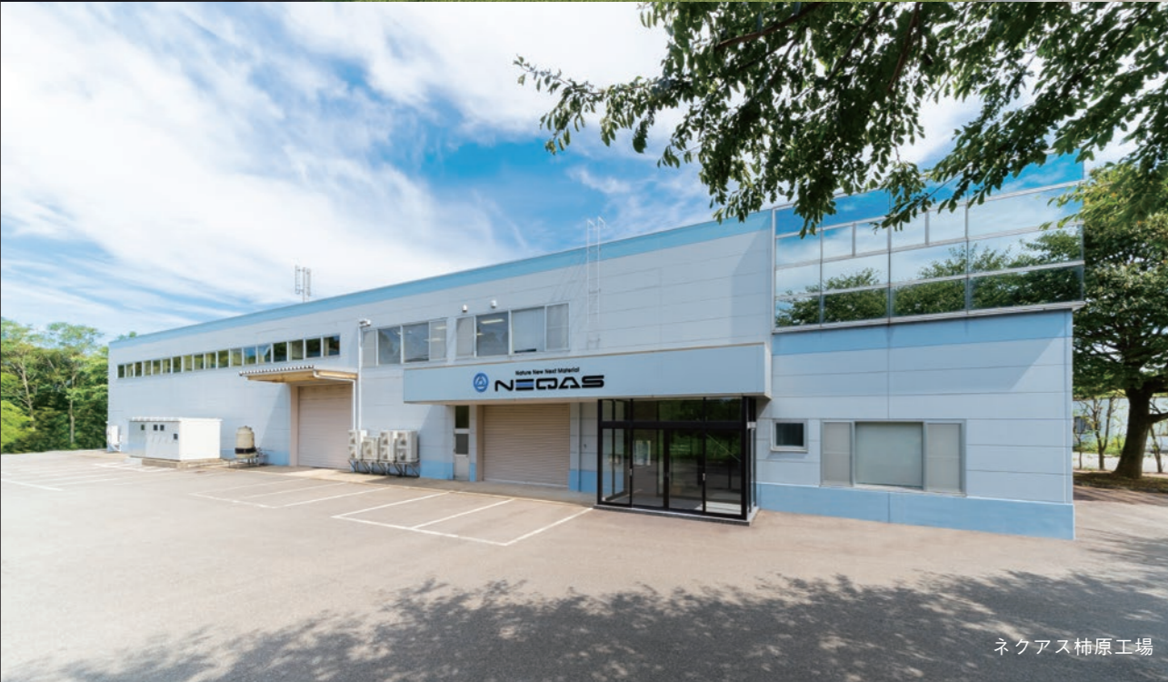
ネクアス柿原工場